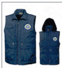
동절기 조끼 25,000원