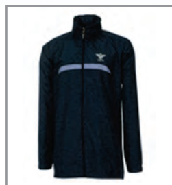
골프·등산용 재킷 25,000원